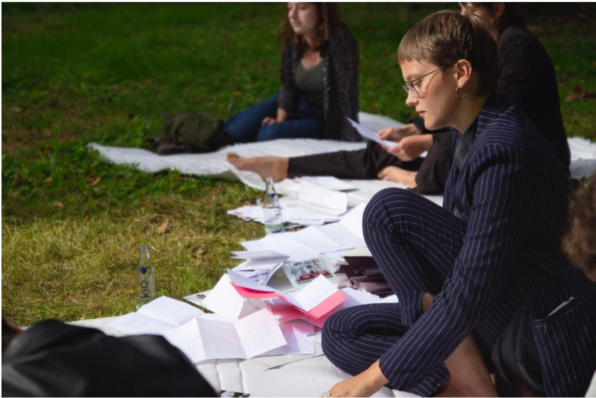
Anna Budniewski, Briefe I , 2021, Lantz'scher Skulpturenpark, Düsseldorf. Fotograf: Phillip Markert