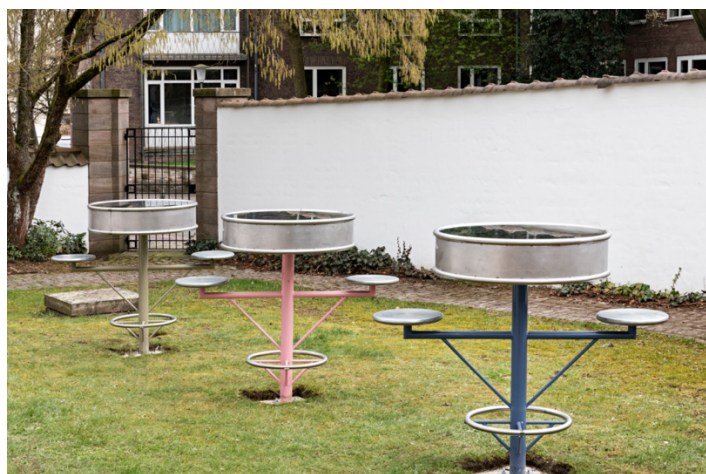
Timothée Calame Mobilier/Documentaire #1, #2, #3, 2020/2022 Rostfreier Stahl, elektrische und beleuchtungstechnische Vorrichtungen, Sicherheitsglas, Lochblech, Aufkleber Stainless steel, electrical and lighting devices, safety glass, perforated plate, stickers 110 x 130 cm Ausstellungsansicht / Exhibition view Don't Say I Didn't Say So Kunstverein Bielefeld 2022