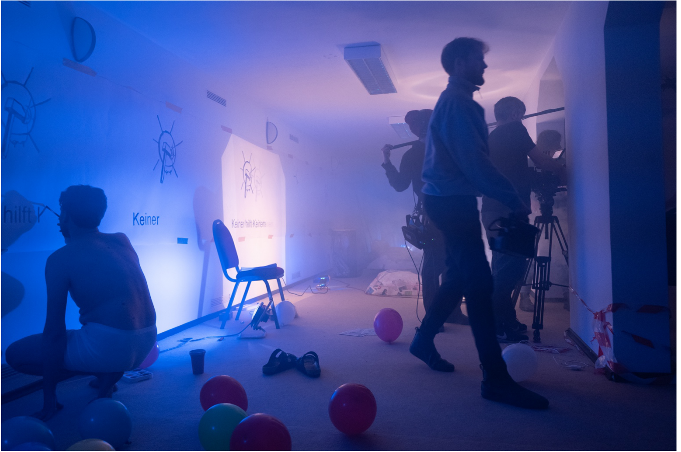
Filmdreh | Film shoot Wissel/Bonny, 2024